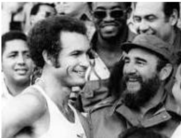
Alberto Juantorena a Fidel Castro

mužstva východního bloku. Kuba v té době po velkém výkonnostním růstu v minulých letech představovala jeden z nejlepších světových týmů, v tomto roce možná vůbec ten nejlepší, protože měla ze světové špičky nejlepší výsledky. Deset let předtím na Kubě žádný zahraniční tým nevyhrál, poslední komu se to povedlo byla v roce 1966 v rámci jihoamerického turné Zbrojovka Brno a od té doby šla Kuba extrémně výkonnostně nahoru. Kubánci byli nadprůměrně