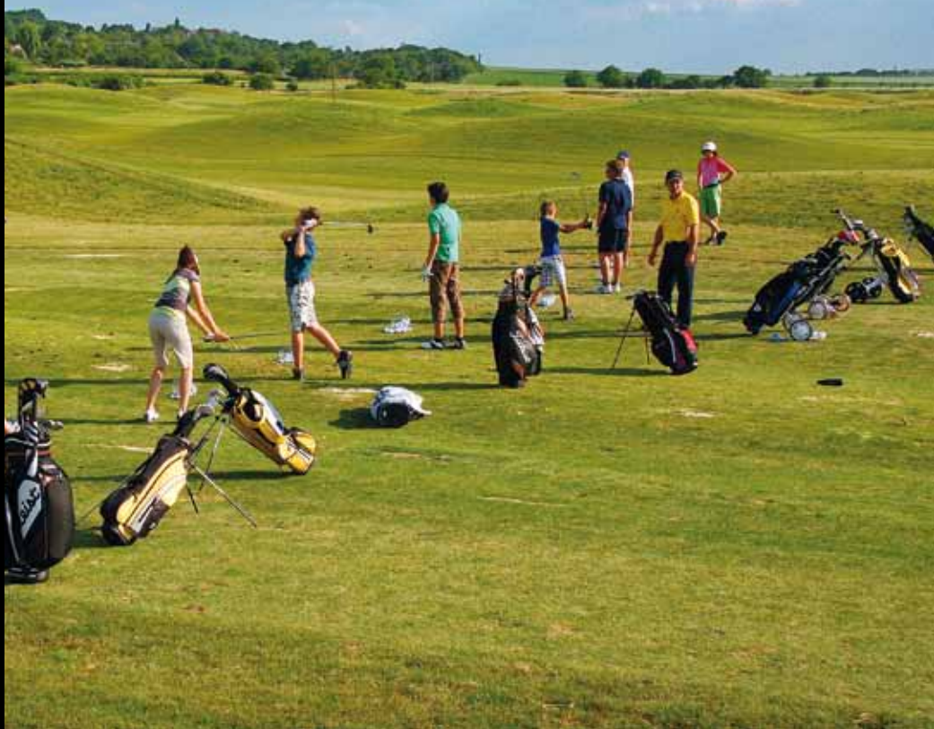
Prostorem tady nemuseli šetřit, proto mají i žáci Akademie Skopový ideální tréninkové podmínky

Nejtěžší jamka, ale je obdobně obtížná jako ta předchozí. Voda zprava od začátku až ke greenu vytváří zátoky zasahující do fairwaye, která dělá pozvolný oblouk. Opět omezení i vlevo, zarostlá mez značená jako červená voda. Ta opravdová voda (zprava) se téměř dotýká greenu. Cestou je několik bunkerů, ale na nejtěžší jamku je vcelku dobře průchoďná.