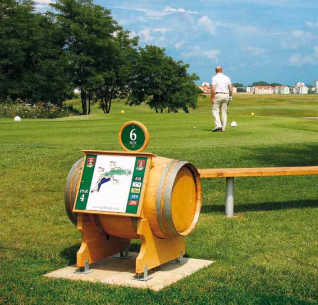
Soudky u každé jamky dotvářejí atmosféru. Pohled od 6. odpaliště přes vodu na Skalici

lem nedá poznat, že jsou na světě teprve chvíličky, greeny ale ještě potřebují svůj čas. Rychlost všech greenů pro počáteční měsíce sjednotili na sedm stop. Ty dvouleté už by určitě vydržely nižší stříh, ale nové ještě ne, tak jim dávají možnost zesílit a rychlost se bude postupně zvedat. Je dobře, že dbají na to, aby nebyly rychlosti různé na první a druhé devítce – leckde se to v těchto situacích stává.