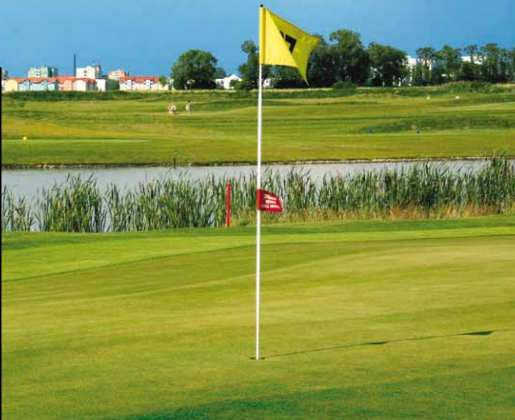
Barevná silueta Skalice uzavírá hřiště na východní straně

Poslední jamka, poslední obtížná rána pro kratší hráče: voda, pak ještě příčná voda s rákosím. „Dlouzí“ se zasmějí a jsou daleko na fairwayi. Pak bunkerové pole na pravé straně a zatáčka doleva k otevřenému greenu.