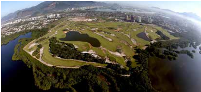
Čerstvé hřiště v Riu pro letošní OH. Žádný větší turnaj se na něm odehrát nestihl. Olympiáda bude křtem ohněm

šla jako blesk z čistého nebe zpráva, že Rory skutečně svou účast odvolává, a rozmýšlí se i vítěz letošního Masters Danny Willett. Nechci být jen negativní, ale těch otázek je spousta. Řada špiček už odvolala svou účast