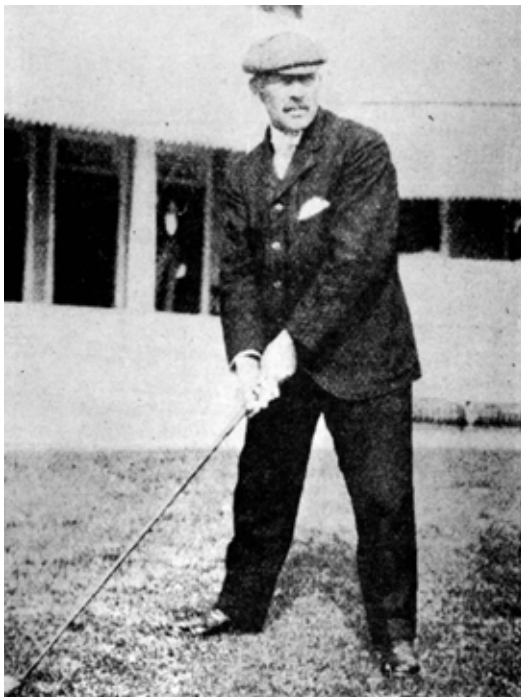
Kanadán George Lyon je poslední olympijský vítěz v golfu, rok 1904

Nechme už značně uleželá historická data spát a podívejme se na žhavou současnost. Golf je sice sport s bohatou historií, ale nejvíc se počítá tady a teď! Ale přece jen kousek zpátky: v roce 2009 – ano, tak dávno už to je – se na 121. zasedání Mezinárodního olympijského výboru podařilo překlenout 101 let starý rozpor, kdy se olympijské hnutí nesešlo s názory