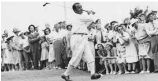
Sarazen, rok 1941. Golf už se těší mnohem větší divácké oblibě, výkony hráčů stoupají, finanční odměny jakbysmet

Pak to utichlo – už se s tím stejně nedalo nic dělat, ale hlavně přehlušila tyto skandály obří korupční aféra týkající se i státní naftařské firmy Petrobras, vážné problémy měla i prezidentka Dilma Rousseff – vyšlo najevo, že před volbami 2014 zakreslovala výsledky brazilské ekonomiky.