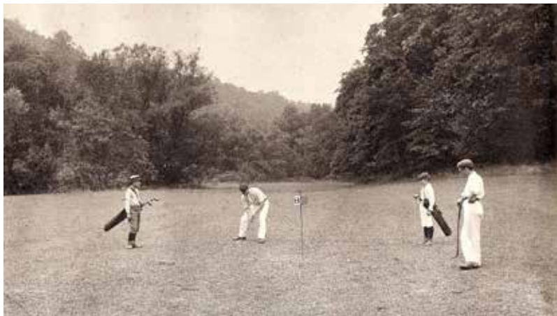
Tak se hrál olympijský golf před více než sto lety. Diváci nikde, mnozí z hráčů ani netušili, že hrají o olympijské zlato

R & A, a golf byl zařazen mezi olympijské sporty. Konalo se hlasování, kterému předcházela prezentace golfových ambasadůrů a které se kromě činovníků zúčastnila i čtveřice předních golfistů – Padraig Harrington, Michelle Wie, Suzann Pettersson a tehdy šestnáctiletý Matteo Manassero, čerstvý vítěz British Amateur. Hlasování dopadlo dobře a golf získal účast na hrách 2016 a 2020.