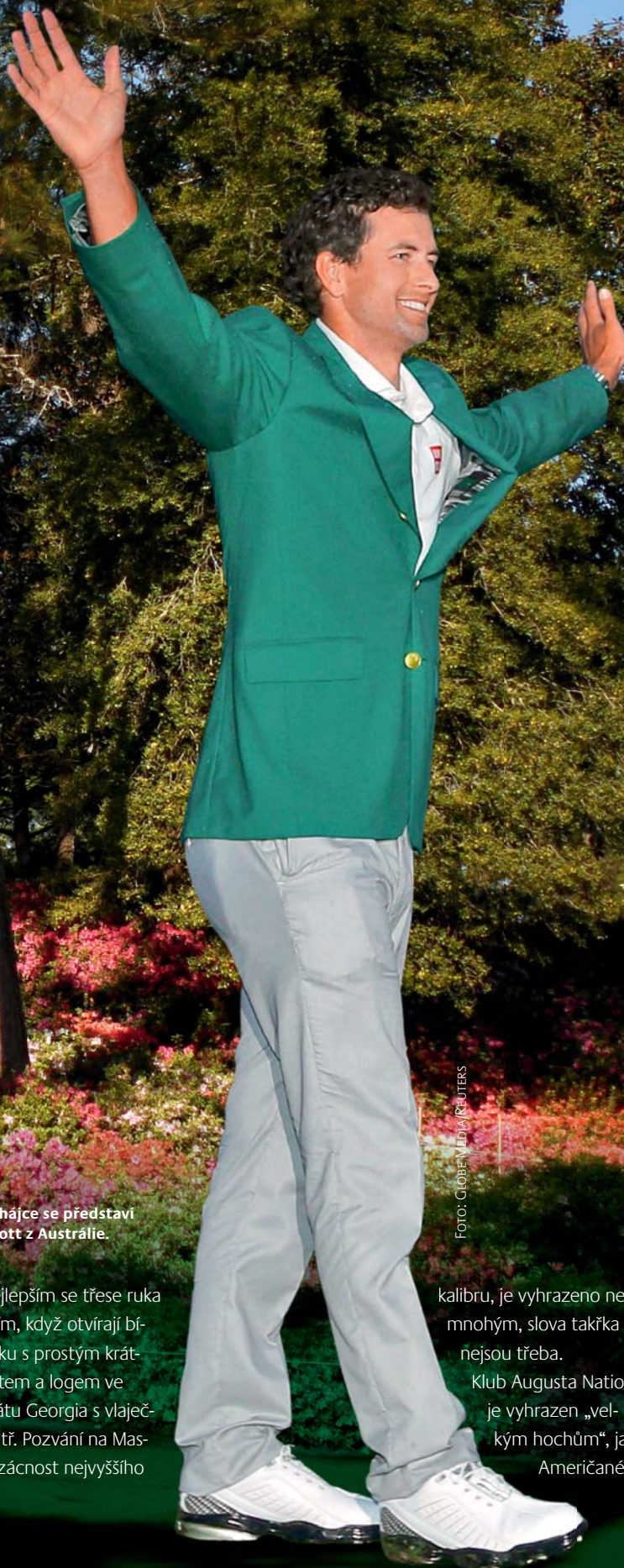
V roli obhájce se představí Adam Scott z Austrálie.