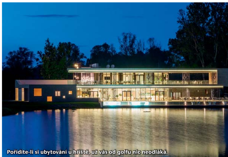
Pořídíte-li si ubytování u hřiště, už vás od golfu nic neodláká.

Rukopis designéra je velice výrazný. Nejen vedení fervejí a zapojení hřiště do terénu, ale i jednotlivosti – třeba tvary bankrů jsou nádherné, hladí na duši. Od první do poslední jamky máte pocit, že hrajete něco mimořádného. Je to v té maďarské krajině jako zjevení. I tréninkové plochy jsou na velmi dobré úrovni. Dva patovací a dva čipovací greeny, odpaliště z trávy i ze zpevněných podložek. Resort umožňuje, aby si sem trenéři přivezli své klienty a absolvovali zde s nimi tréninky.