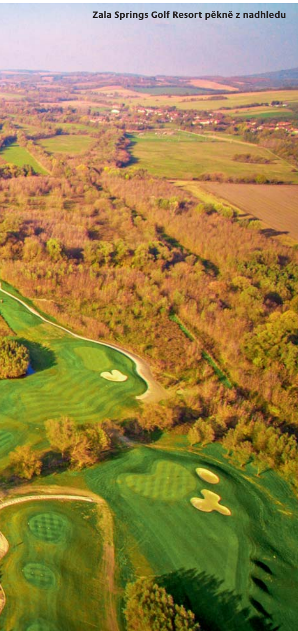
Zala Springs Golf Resort pěkně z nahledu