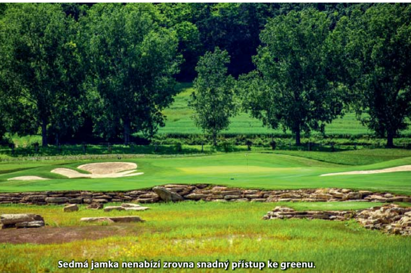
Sedmá jamka nenabízí zrovna snadný přístup ke greenu.