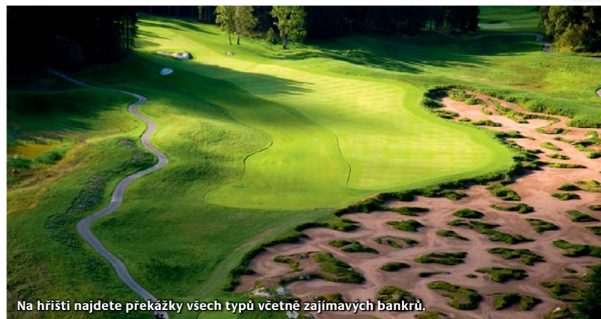
Na hřišti najdete překážky všech typů včetně zajímavých bankrů.