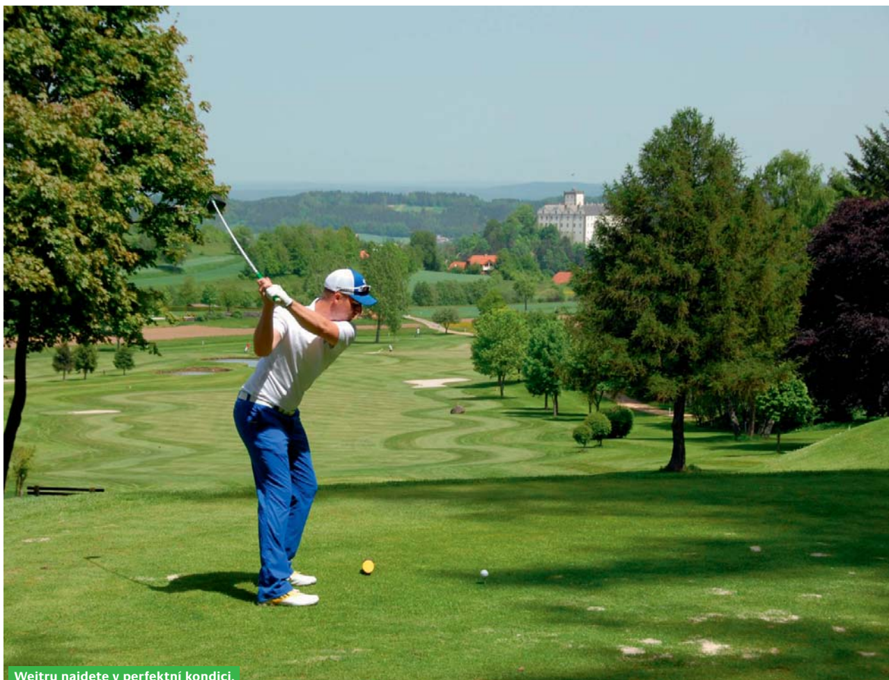
Weitru najdete v perfektní kondici.