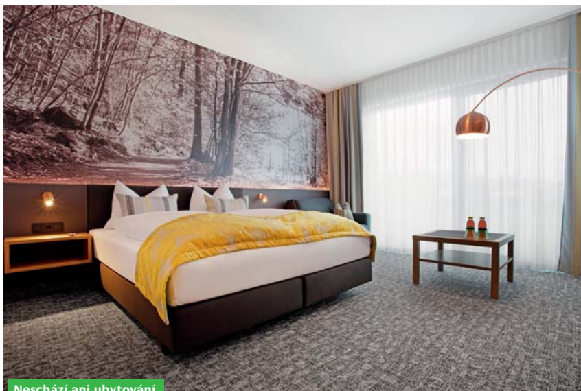
Neschází ani ubytování.

I samo blízké městečko má co nabídnout – zámek je překrásný, historický střed města ve vás oživí vzpomínku na staré časy, kdy ještě všemu nevládly auta a široké silnice. A pokud byste chtěli přespat a nevešli se do pokojů, které hotel na hřišti nabízí, na ná-