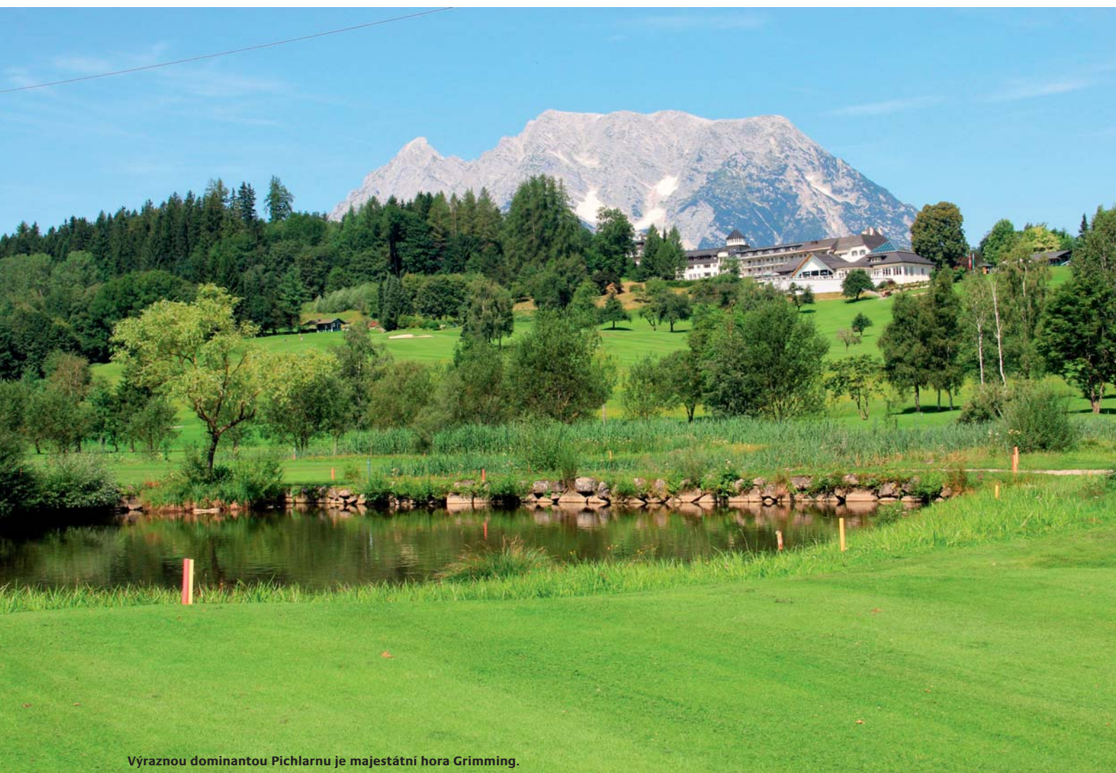
Výraznou dominantou Pichlarnu je majestátní hora Grimming.

Fantastický Hotel Pichlarn , jehož jedna část je v tisíc let staré stavbě zámku, je unikátní tím, co všechno poskytuje. Víc než metrové zdi ve staré části stavby, kulinařské zážitky, nádherné a prostorné wellness, velký, i v zimě vytápěný venkovní bazén, pokoje o mnoho větší a komfortnější, než jste zvyklí. Potkat zde můžete nejen golfisty, ale třeba i světové fotbalové týmy na utajených oddychových pobytech. Už jste jeli s Ronaldem ve výtahu? Hotel určitě stojí za hřích, byť není z nejlevnějších. Ale zážitky, jaké vám poskytne, hned tak někde nekoupíte... ■