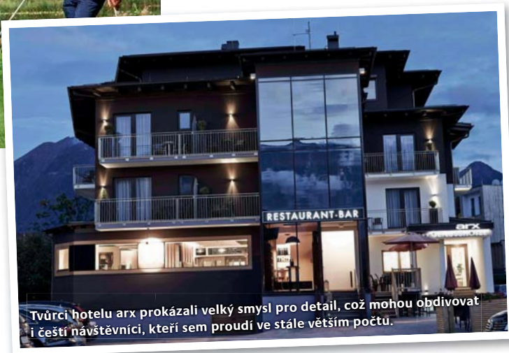
Tvůrci hotelu arx prokázali velký smysl pro detail, což mohou obdivovat i čeští návštěvníci, kteří sem proudí ve stále větším počtu.

„To není jen tak, je potřeba stále vyvíjet veškerou snahu, aby příroda zůstala zachována ve své původní podobě,“